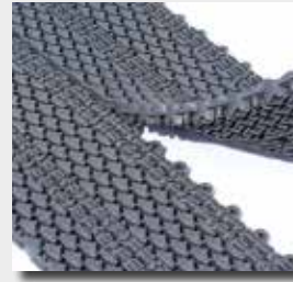
Connexion entre les dalles