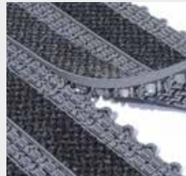
Connexion entre les dalles