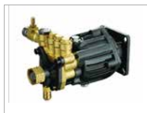
POMPES AXIALES PRO LAITON – 3 PISTONS INOX PW 150/8 SAB-L XR PW 160/9 SAB-L XR