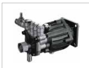
POMPE AXIALE PRO ALPAX – 3 PISTONS INOX PW 150/8 SAB XR