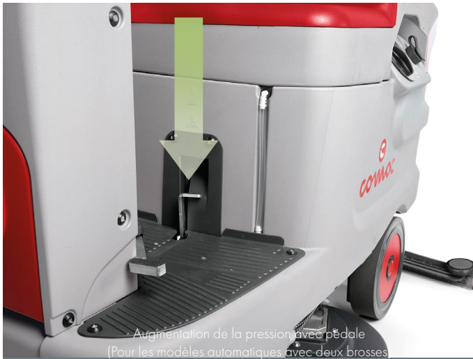
Augmentation de la pression avec pédale (Pour les modèles automatiques avec deux brosses)