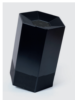
Noir mat RÉF. 111036