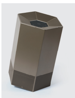
Bronze RÉF. 110832