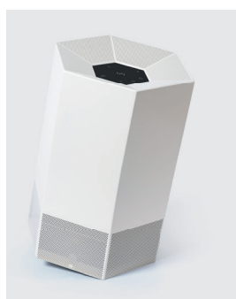
Blanc crème RÉF. 110821