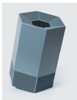
Bleu Saphir RÉF. 111023