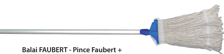
Balai FAUBERT - Pince Faubert + Frange 350g + Manche aluminium 1,40m Réf : 0022005