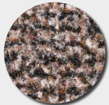
Fibres grattantes + absorbantes mouchetées