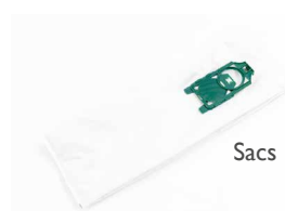
Sacs poussière (lot de 10)